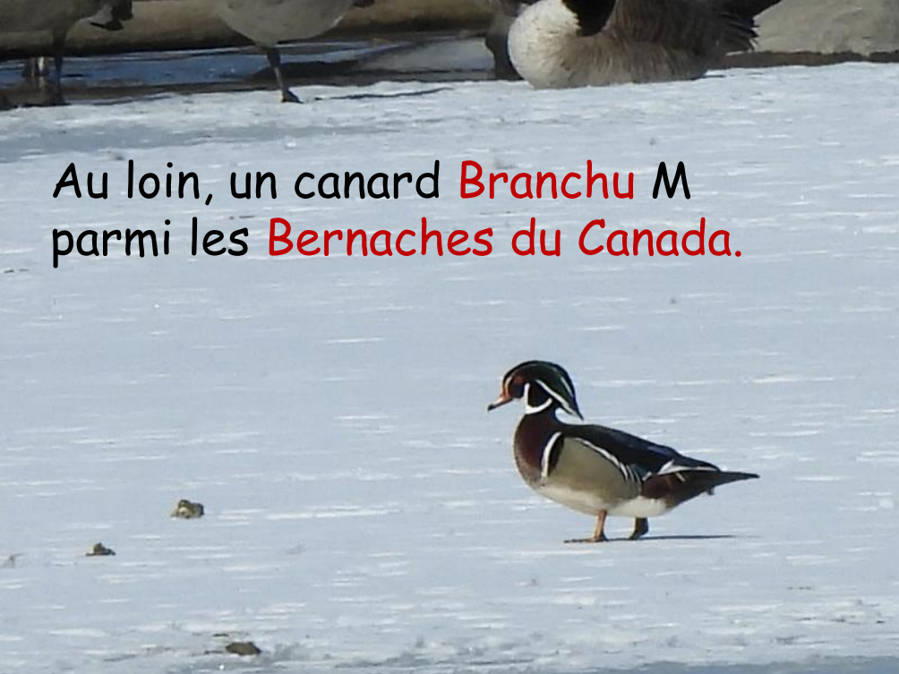
Au loin, un canard Branchu M parmi les Bernaches du Canada .