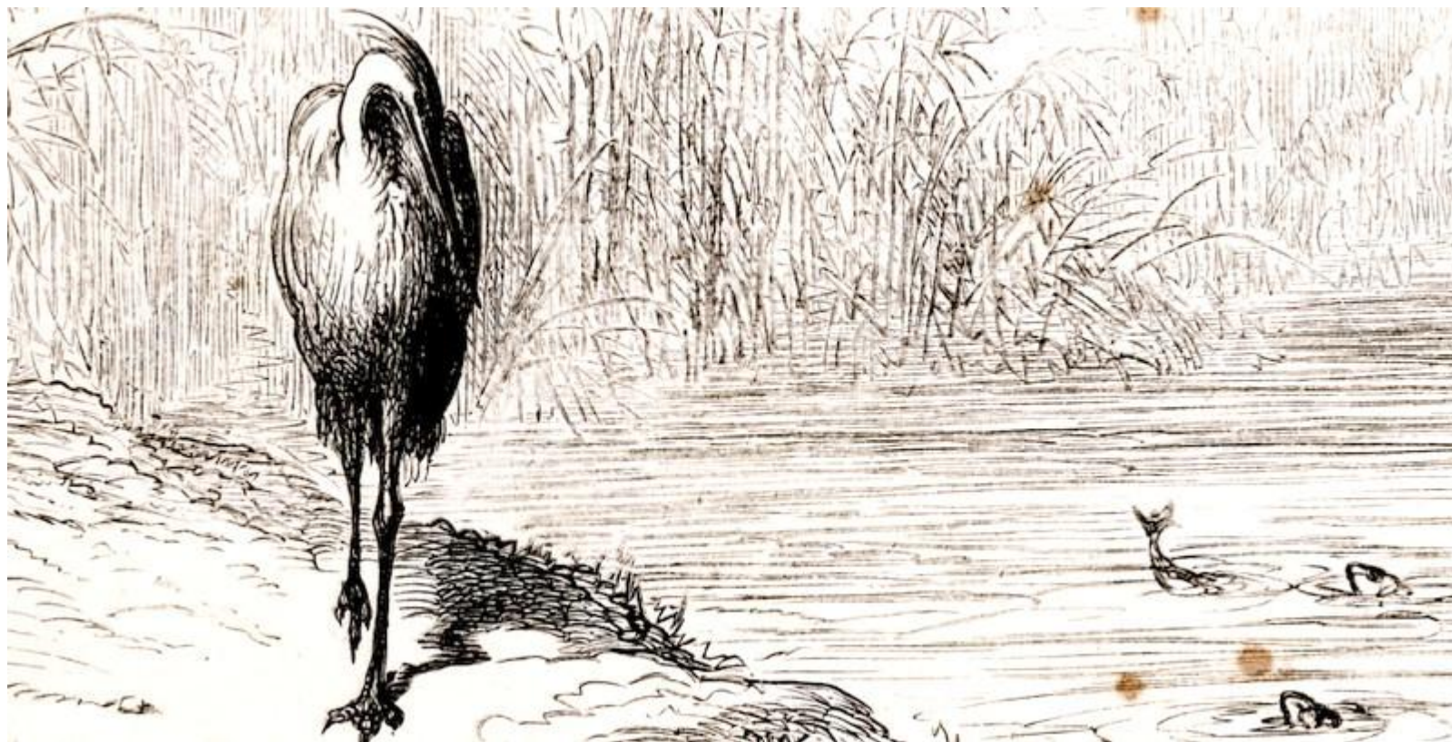
Fable de Jean de La Fontaine

Un jour sur ses longs pieds allait je ne sais où Le Héron au long bec emmanché d'un long cou. Il côtoyait une rivière. L'onde était transparente ainsi qu'aux plus beaux jours ; Ma commère la Carpe y faisait mille tours Avec le Brochet son compère. Le Héron en eût fait aisément son profit : Tous approchaient du bord, l'Oiseau n'avait qu'à prendre ; Mais il crut mieux faire d'attendre Qu'il eût un peu plus d'appétit. Il vivait de régime, et mangeait à ses heures. Après quelques moments l'appétit vint ; l'Oiseau S'approchant du bord vit sur l'eau Des Tanches qui sortaient du fond de ces demeures. Le mets ne lui plut pas ; il s'attendait à mieux, Et montrait un goût dédaigneux Comme le Rat du bon Horace. (1) Moi des Tanches ? dit-il, moi Héron que je fasse Une si pauvre chère ? Et pour qui me prend-on ? La Tanche rebutée (2), il trouva du Goujon. Du Goujon ! c'est bien là le dîné d'un Héron ! J'ouvrirais pour si peu le bec ! aux Dieux ne plaise ! Il l'ouvrit pour bien moins : tout alla de façon Qu'il ne vit plus aucun Poisson. La faim le prit ; il fut tout heureux et tout aise De rencontrer un Limaçon. Ne soyons pas si difficiles : Les plus accommodants, ce sont les plus habiles : On hasarde de perdre en voulant trop gagner. Gardez-vous de rien dédaigner ; Surtout quand vous avez à peu près votre compte. Bien des gens y sont pris ; ce n'est pas aux Hérons Que je parle ; écoutez, humains, un autre conte ; Vous verrez que chez vous j'ai puisé ces leçons.