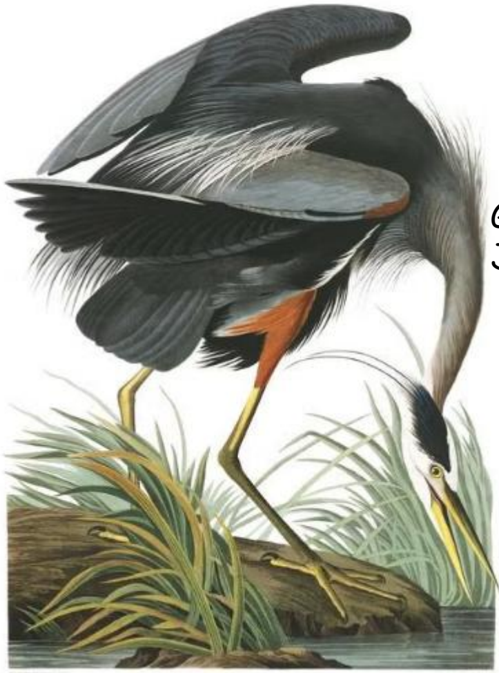
Grand Héron par John James Audubon